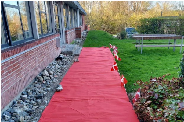
Det var en festdag, da Hjemme- og Sygeplejen 8. april overgik til de nye, tværfaglige teams.

Der blæser nye vinde over Aabenraa Kommunes hjemme- og sygepleje, som fra 8. april i år nu er under samme centerleder som én organisation – nemlig med nye tværfaglige teams. Koordinatorer er ansat til at koordinere tværfagligt for både SOSU'ere og sygeplejersker, så borgerne får lige præcis den hjælp, de har brug for.