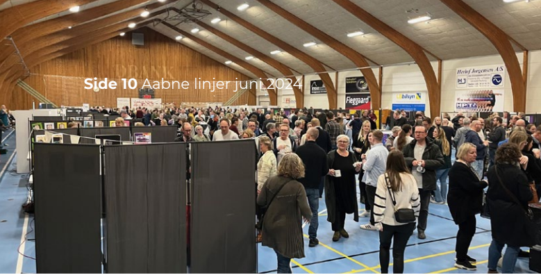
Alle lærere fra Aabenraa Kommune var inviteret til udviklingsdag i projektet Universitetsskolen.