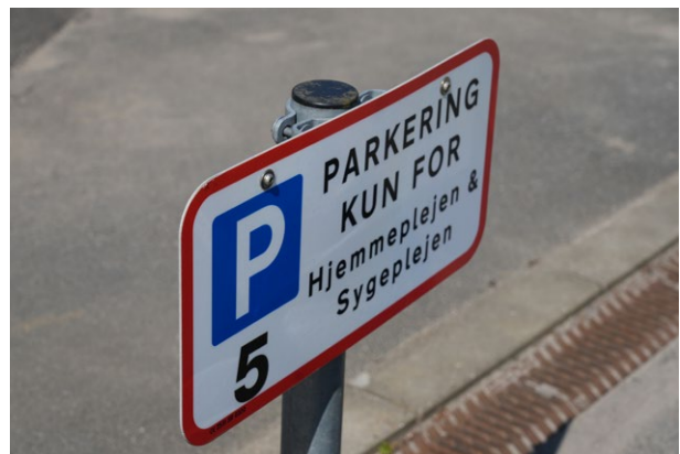
Parkeringspladsen ved Nygade, som er base for de nye elbiler.

I løbet af 2024 kommer der 90 nye biler, hvoraf 41 er rene elbiler, mens resten er hybridbiler.