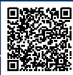
Foto: Genereret med kunstig intelligens.