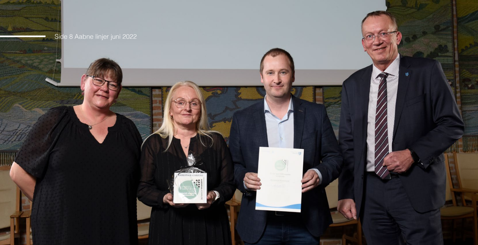
Aabenraa Kommune modtog CSR-mærke 2022 i byrådssalen i lighed med 92 andre arbejdspladser fra kommunen.