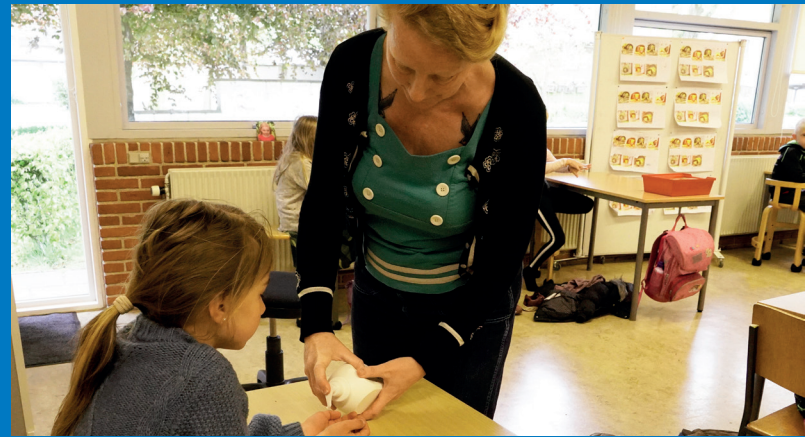
Lærerne har også påtaget sig nye opgaver under COVID-19 som blandt andet at sørge for, at børnene får vasket hænder flere gange om dagen og tilbyder håndcreme til den tørre hud på de små hænder.

- Hvis man gerne vil rekruttere kvalificerede medarbejdere til en bestemt type stillinger, hvorfor skal man så tvinge folk til at arbejde geografisk i en kommune? Når det hele skal drøftes igennem på bagkant af det her, så er man nødt til at gå åbensindet ind til det, siger han og tilføjer: