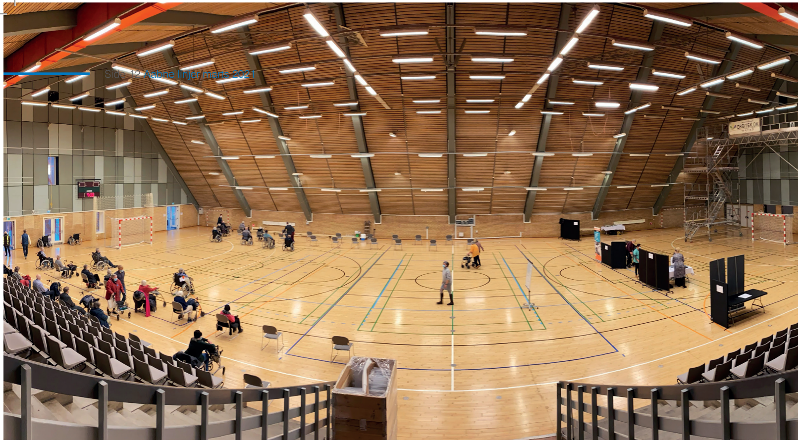
Arena Aabenraa er et af de steder, hvor borgere og frontpersonale er blevet og vil blive vaccineret mod COVID-19.