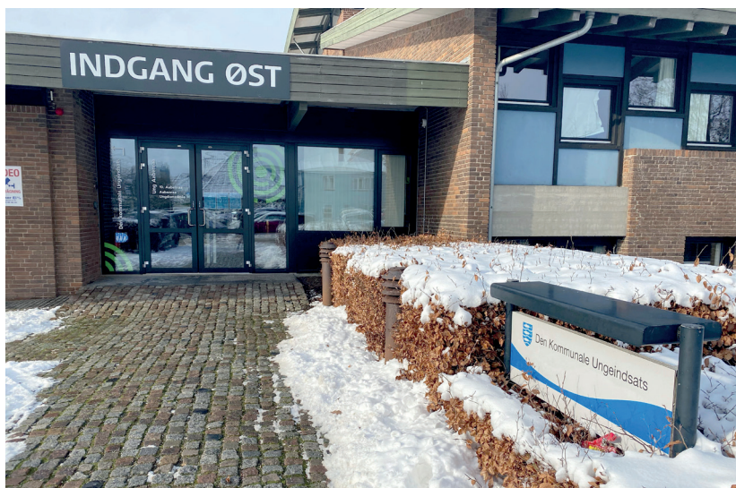
Det er på Dronning Magrethes Vej i Aabenraa, at Ungeindsatsen for alvor har fundet sig til rette i en fælles indsats til gavn for kommunens unge.

- Tæt kontakt mellem fagpersoner giver den bedst mulige hjælp til de unge mennesker, der har brug for det. Vi har meget fokus på at lave individuelle planer for de unge, og vi ved, at det virker, når vi skrider