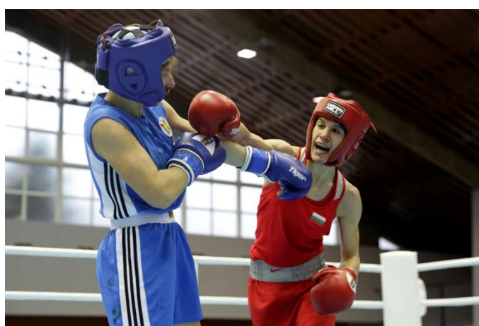
"hvordan lærer eleven bedst?"

Det er vigtigt, at eleven får løbende sparring / har fælles refleksion sammen med sin vejleder eller andre i gruppen/afdelingen på de opgaver der laves.