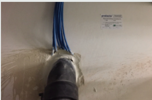
Rørgennemføring korrekt udført.

Mærkatene viser, at der er lukket med et godkendt materiale.