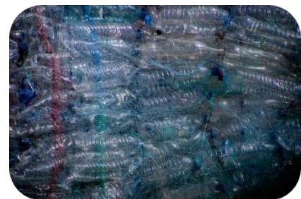
Overfladen på leg- og lærings-måtterne er fremstillet af genanvendte plastikflasker.