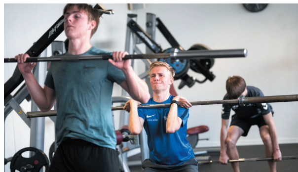
Under Kick-Off fik de unge sportsudøvere mulighed for at blive kloge på fysisk træning.