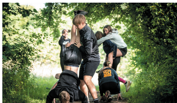
Der var fokus på teambuilding i løbet af Elite Aabenraas Kick-Off Weekend.