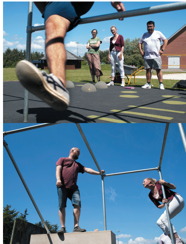
▲ Den nye parkourbane er allerede taget i brug af flere af lærerne i forbindelse med undervisningen.