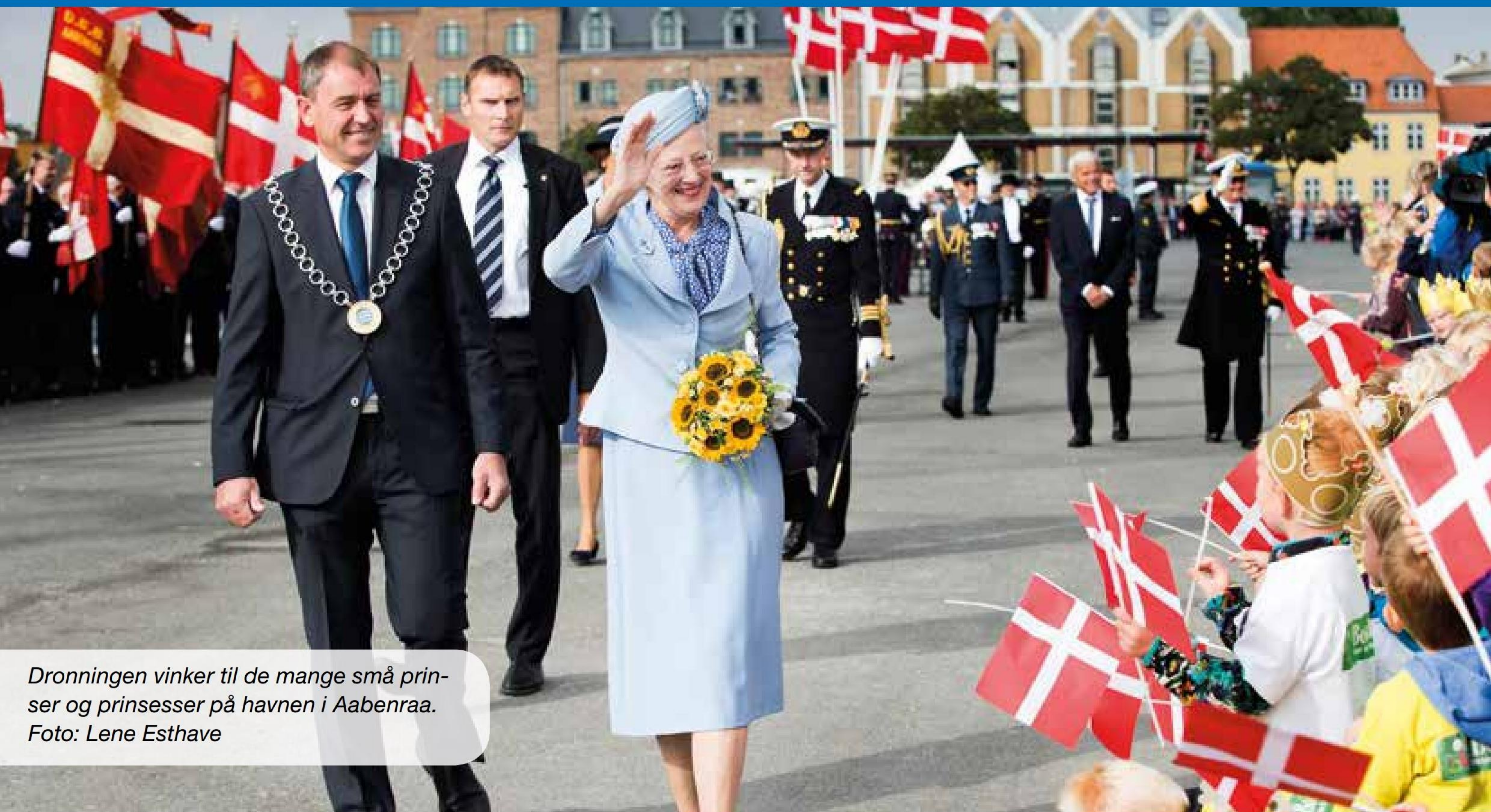
Dronningen vinker til de mange små prinser og prinsesser på havnen i Aabenraa.