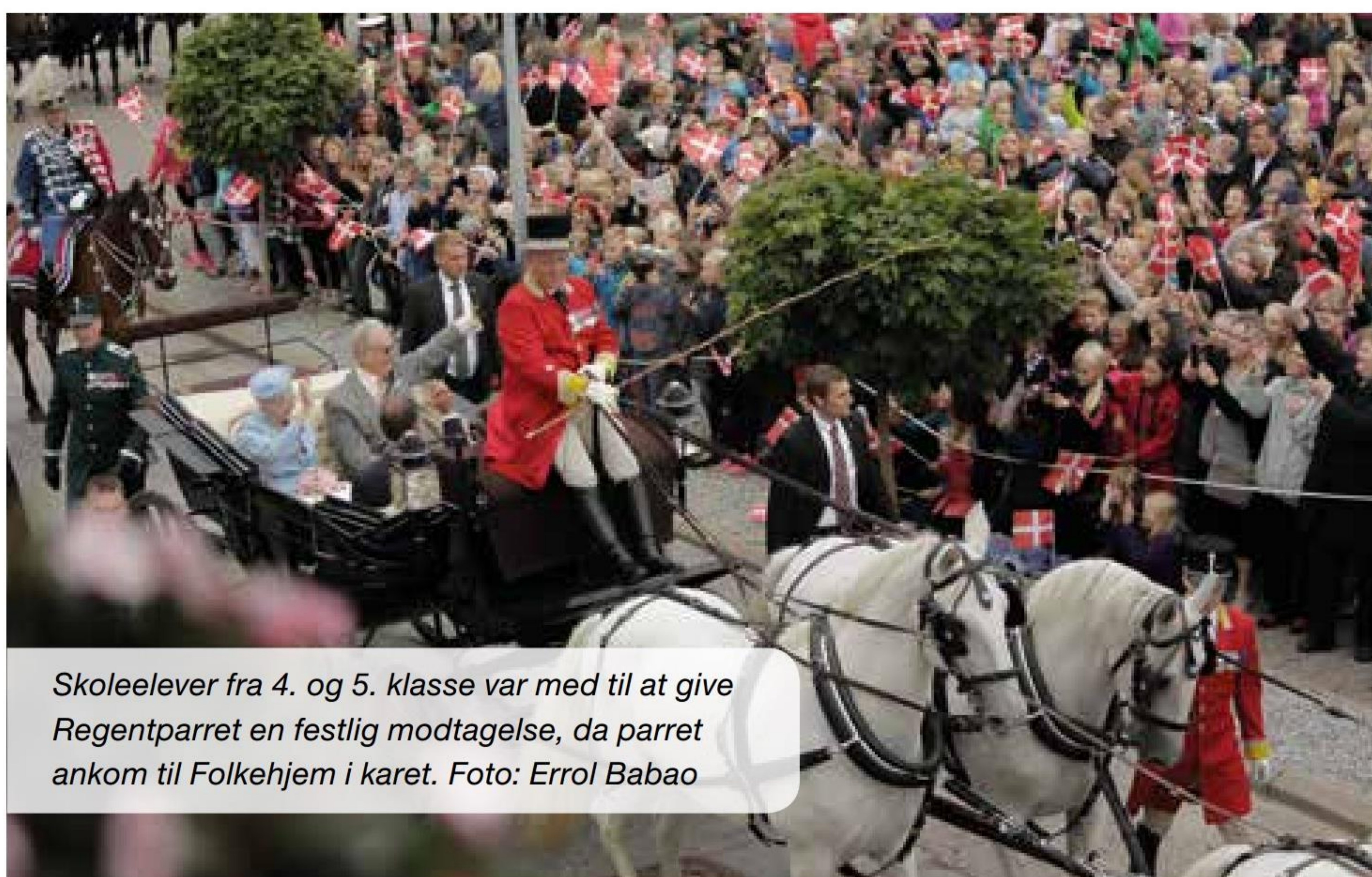
Skoleelever fra 4. og 5. klasse var med til at give Regentparret en festlig modtagelse, da parret ankom til Folkehjem i karet.

Herefter trådte regentparret ud på balkonen, mens børnene hujede og viftede med Dannebrog. Kort efter kørte Krone 1 og Krone 101 regentparret til hvert deres stop i det travle program. Eleverne fra Hovslund vinkede tilfredse "farvel" og gik tilbage mod bussen.