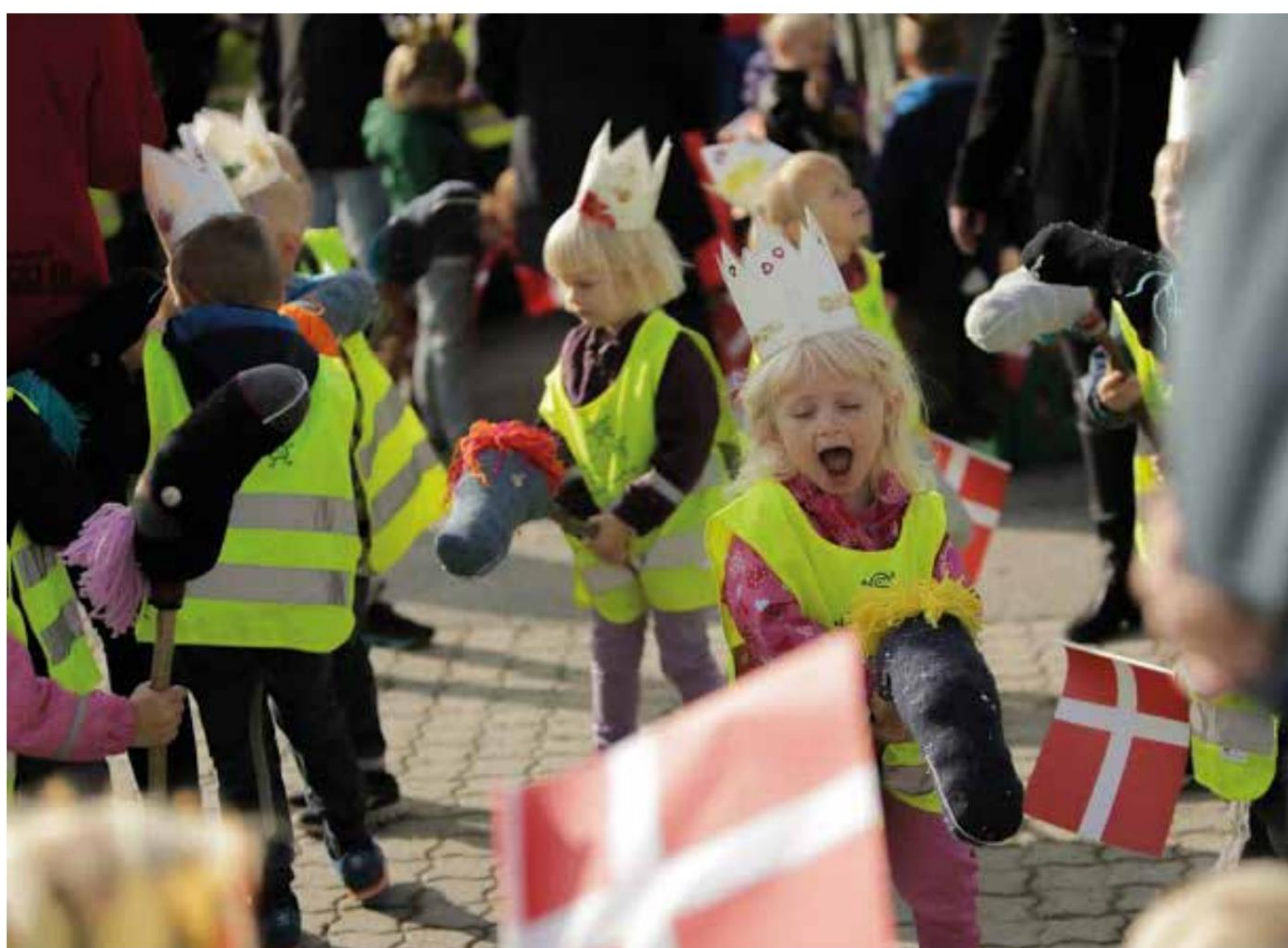
Der var feststemning på havnen i Aabenraa, da dronningen blev modtaget - ikke mindst blandt de mindste.

På parkeringspladsen foran Folkehjem stimlede 4.-og 5. klasserne fra kom-