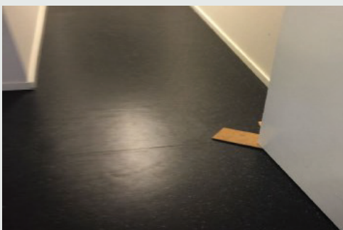
Kritisk forhold: Midlertidig dørstopper