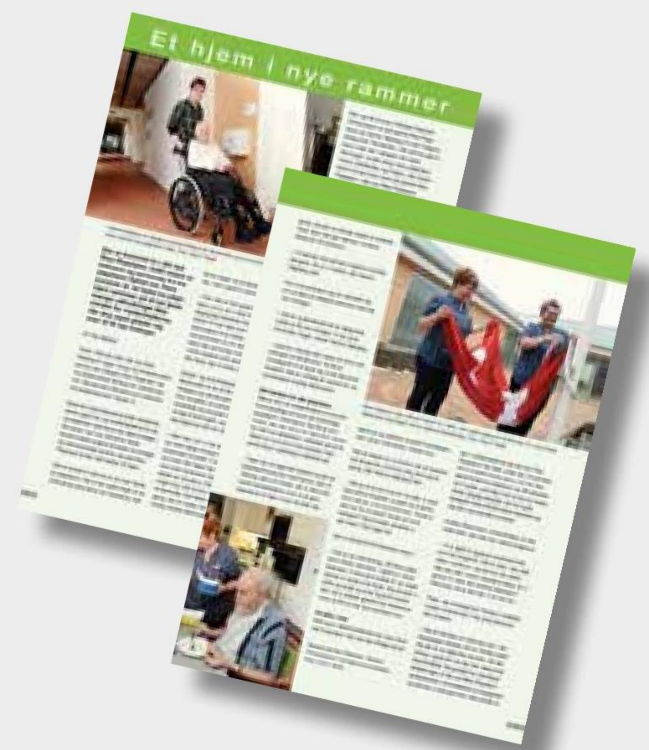
I 2013 flyttede beboere og medarbejdere fra det tidligere Rise Plejehjem, Ældrecenter Midtpunkt i Bolderslev og plejehjemmet i Kliplev sammen i Rise Parken.

- Vi har fået en akutaflastning for borgere, der har problemer med alkohol- eller medicinmisbrug. Det er en ny gruppe borgere for mig, så det er positivt, at ledelsen lytter, når jeg efterspørger nye kompetencer.