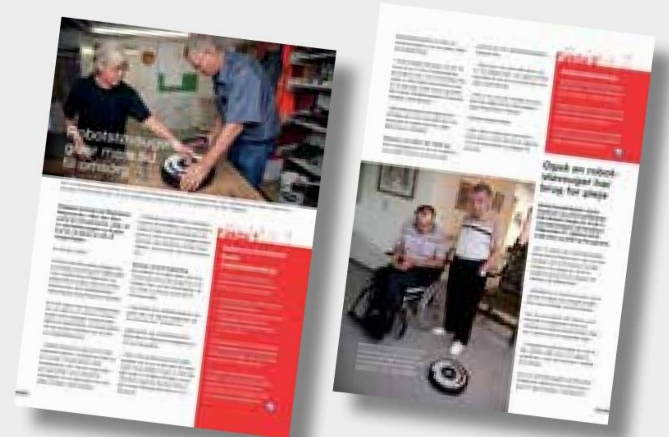
I 2011 testede Rønshave Plejecenter i Bov robotstøvsugere.