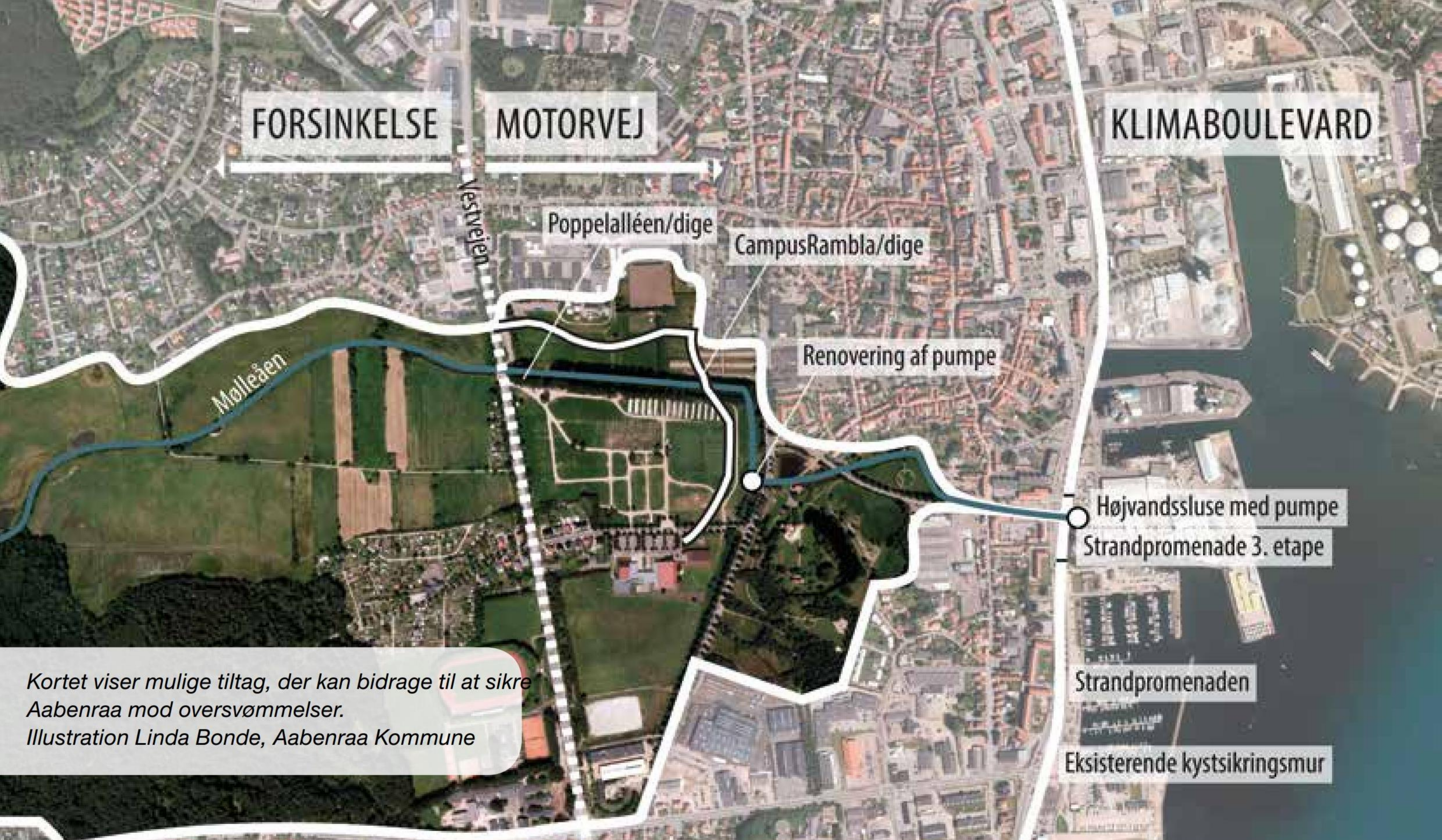
Kortet viser mulige tiltag, der kan bidrage til at sikre Aabenraa mod oversvømmelser. Illustration Linda Bonde, Aabenraa Kommune