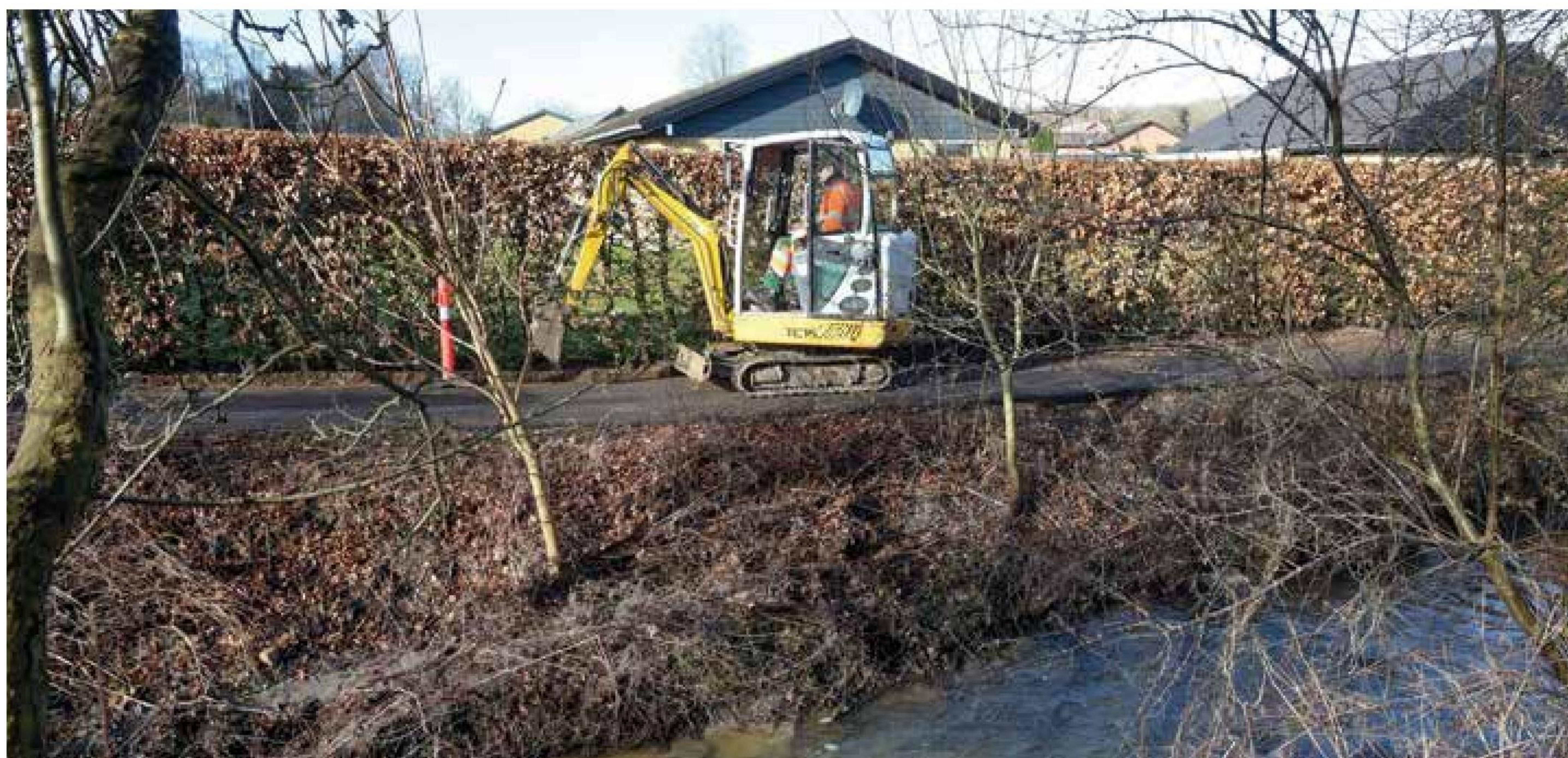
Et mindre dige ved Ærholm i Aabenraa forlænges og forhøjes for at mindske risikoen for oversvømmelser, når åen går over sine bredder.

I Aabenraa blev store arealer og veje oversvømmet i dagene 26. og 27. december 2015, ved Søstvej/Skovparken, Bøndervej/Bønderengene/Virkelyst, Ærholm/Enghaven, Dyrskuepladsen, nord for Poppelalléen samt ved Slotsmøllesøen.