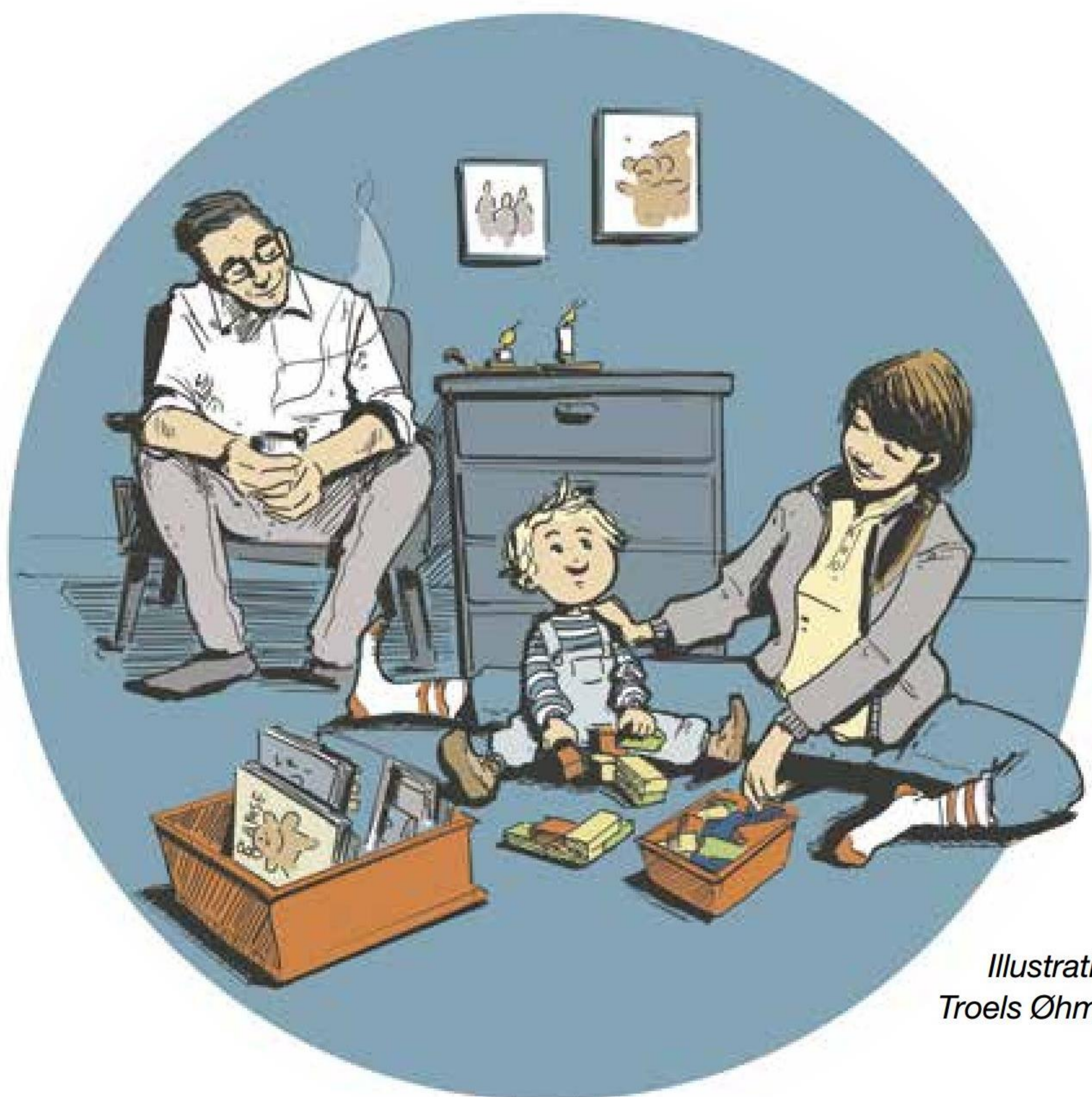
Illustration: Troels Øhman

- Det er hele tiden barnets tarv, det handler om. Når forældreevnen ikke ser ud til at kunne udvikles, skal kommunen ikke trække sagen i langdrag af hensyn til forældrene. Børnene er ikke forældrenes ejendom. Barnet er et selvstændigt individ, som har ret til et liv, hvor det kan udvikle sig og trives.