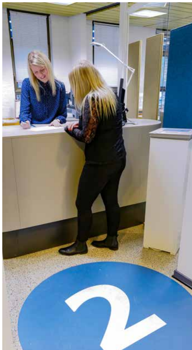
Der er kommet en mere tydelig adskillelse og afskærmning imellem hver enkelt skranke.

Hele processen med at få skabt den nye indretning af Borgerservice på rådhuset lægger kontorlederen ikke skjul på har været en krævende proces. Det har været stor