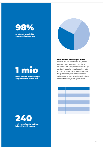
Eksempel på publikation