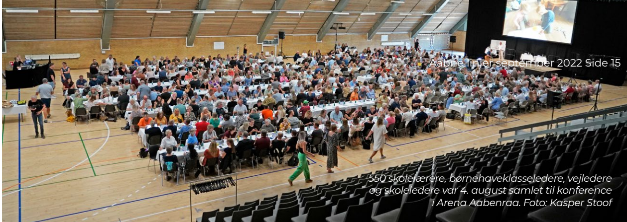
550 skolelærere, børnehaveklasseledere, vejledere og skoleledere var 4. august samlet til konference i Arena Aabenraa.