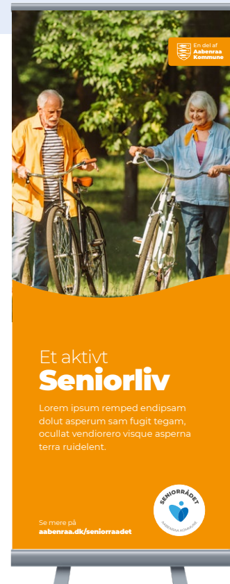
Eksempel på flyers og foldere