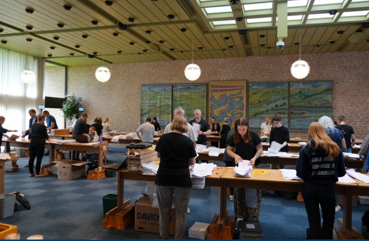
Medarbejdere fra Aabenraa Kommune hjalp med fintællingen dagen efter Europaparlamentsvalget.