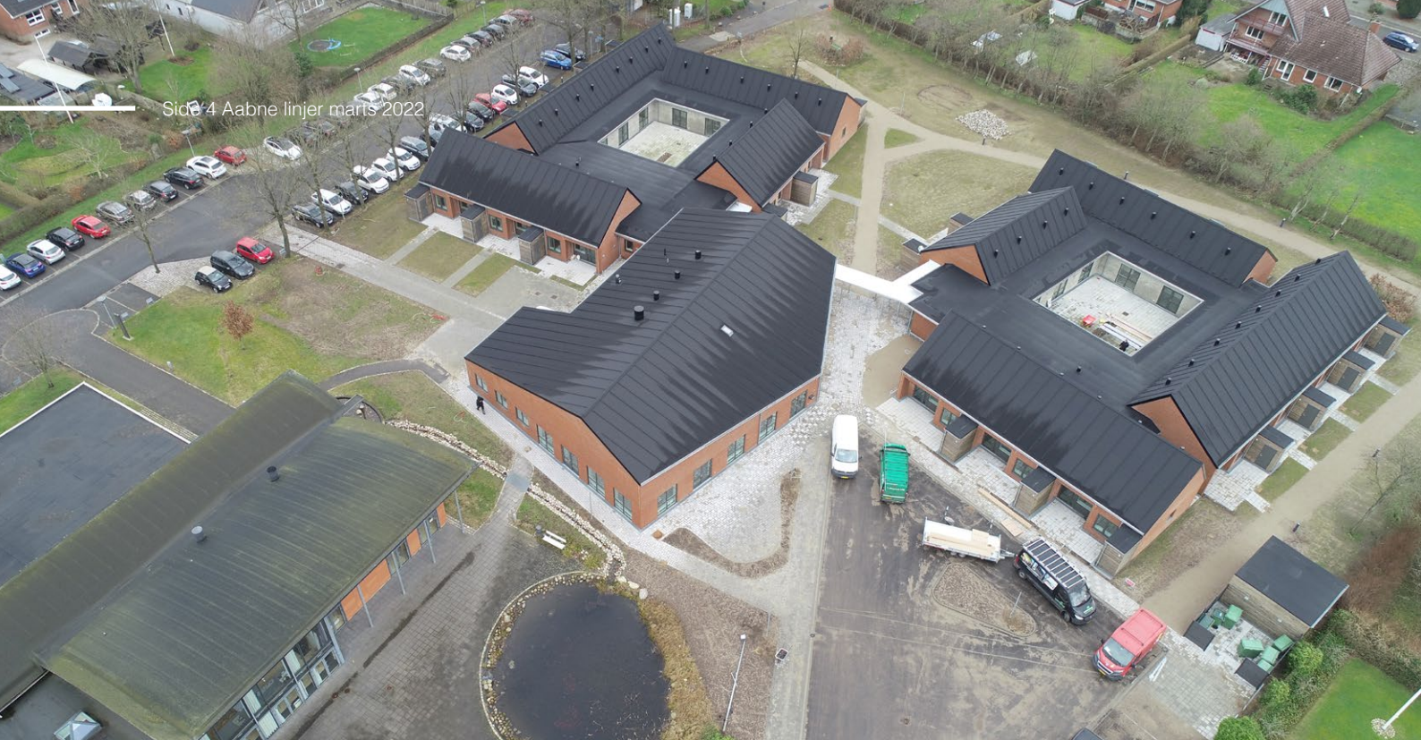
Ny Grønningen giver nye moderne rammer til beboerne og kommunens medarbejdere.