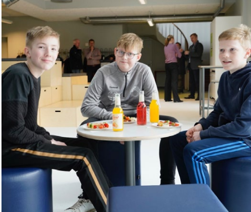
◀ Eleverne på Bylderup Skole fejrede blandt andet indvielsen med lidt at spise og drikke.