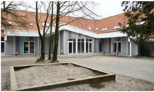
▲ Tilbygningen på Bylderup Skole ser ikke ud af meget, men de 110 m 2 giver rum til ekstra udfoldelse for eleverne.