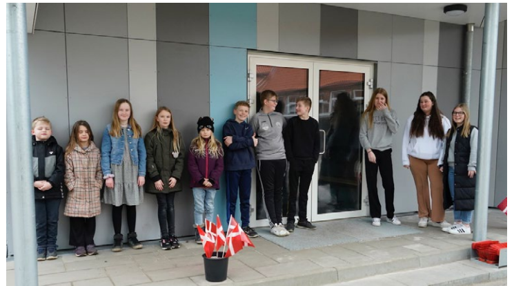
▲ Bylderup Skoles elevråd stod klar til at tage imod gæster til indvielsen.