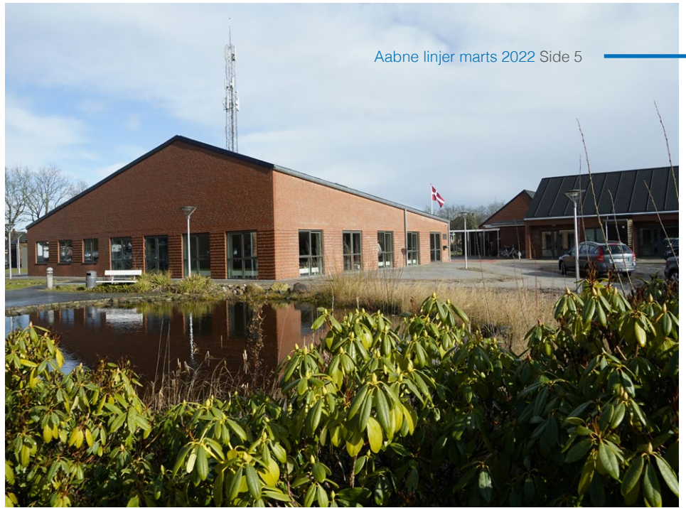
▲ Flaget var hejst til indvielsen af Ny Grønningen.